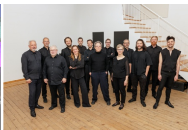
Christoph Sietzen, Motus Percussion & ænm