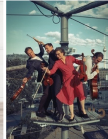
NAMES © Bernhard Müller, Münchener Kammerorchester © Daniel Delang, Kuss Quartett © Rüdiger Schestag